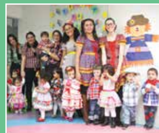
ARRAIÁ DO KIDS

No dia 04/10, comemoramos o dia Mundial dos Animais. Aqui na nossa cidade existe uma Ong que dá abrigo e cuida de animais abandonados. Os alunos da Educação Infantil estudaram os animais e perceberam a necessidade de ajudar esses bichinhos. Nossos alunos recolheram ração para doação. As doações foram encaminhadas para a Ong Resgacti Proteção Animal.