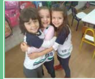
Dia do ABRAÇO

Quando se fala de Copa do Mundo, todos se unem para torcer por seu país. Aqui no XIX não foi diferente: professores e alunos deram verdadeiro "show de bola" nesta atividade temática. Pintamos uma enorme bandeira do Brasil com decalques das palmas das mãos e celebramos esse evento com um desfile em verde e amarelo!